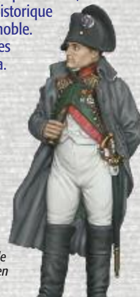
Illustration figurine Métal Modèle présent sur le village napoléonien

Ils établiront leur bivouac dans les communes où Napoléon s'arrêta. Premier arrêt à Cannes.