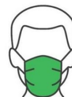
Masque obligatoire Mask obligatory

Le port du masque, homologué de type 1, couvrant le nez, la bouche, le menton, est obligatoire pour tout visiteur âgé de 11 ans et plus et ce pour toute la durée de la visite au musée.