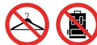
Vestiaires fermées Wardrobe closed