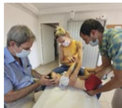
LES OSTEOS DU COEUR À L'ESPACE FRANCE SERVICES DE VALLAURIS

Cependant, comme la Haute Autorité de la Santé l'a indiqué le 8 novembre dernier, le vaccin Moderna n'est pas recommandé pour les populations de moins de 30 ans. Le centre de vaccination de Golfe-Juan ne pourra donc pas vacciner les personnes de moins de trente ans et ce jusqu'à la réception de dotations en Pfizer.